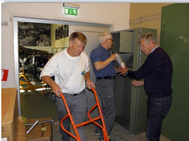
Omflyttning av material till olika skåp.