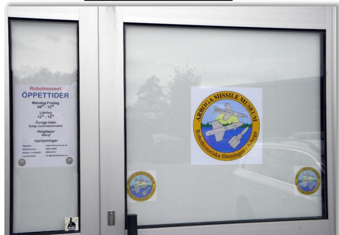
Museets baddörr ser lite trevligare ut med vår logga.