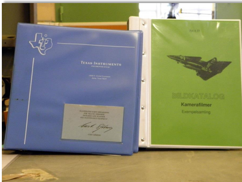
Underlag till värmekamera som vi har fått samt flera kameror.