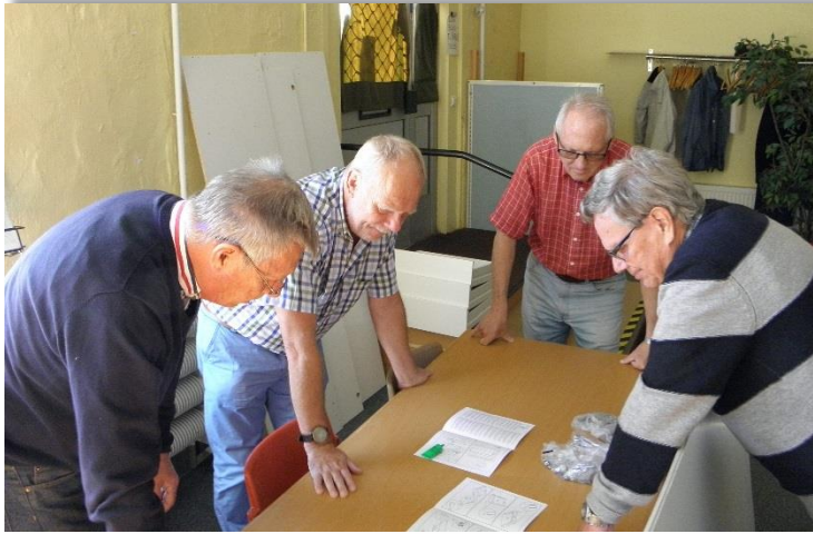
Genomgång av beskrivning för att sätta ihop garderoben.