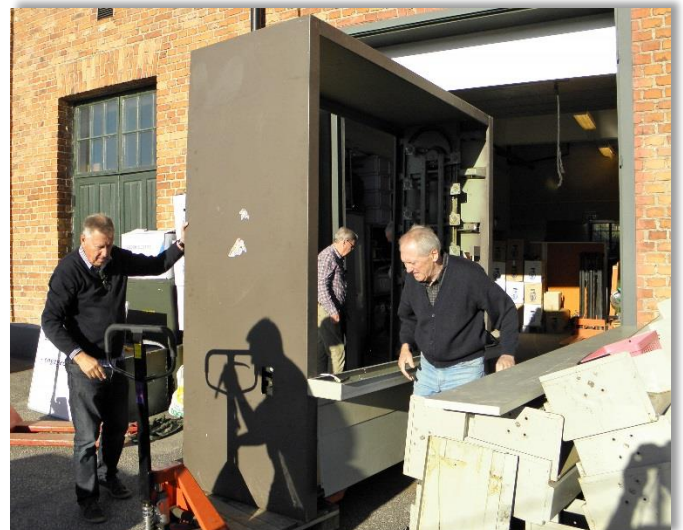
Megamaten på väg ut.